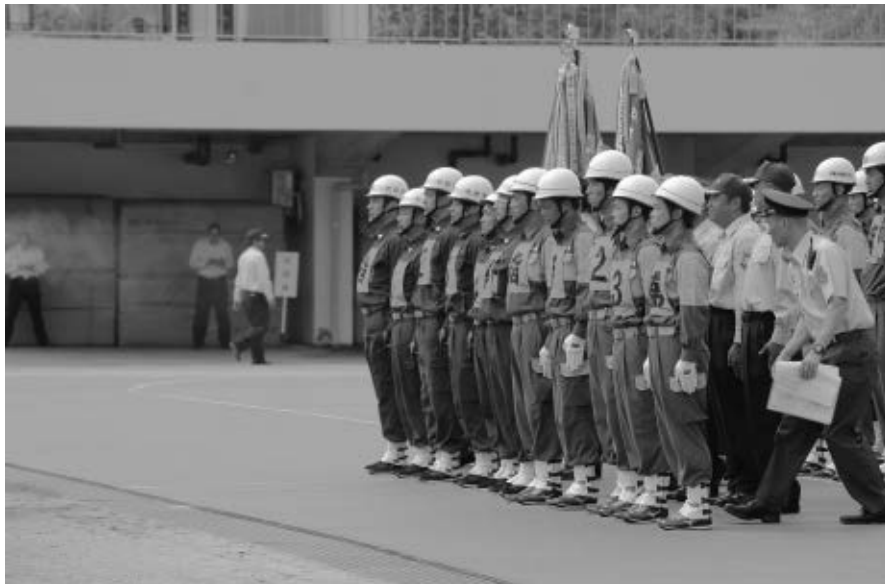
大阪府消防大会の様子（令和元年度）