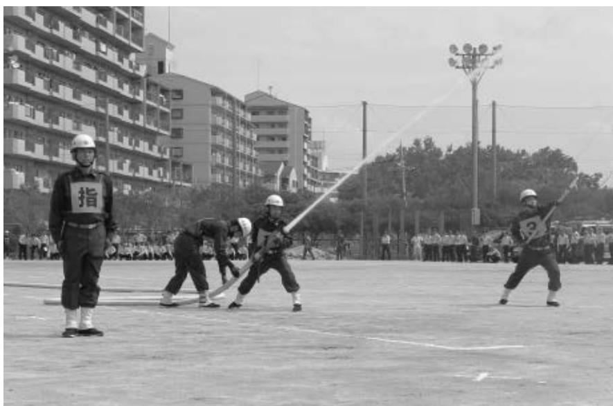
三島地区支部総合訓練の様子（令和元年度）