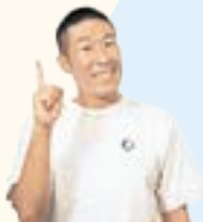
番組MC 田村 裕