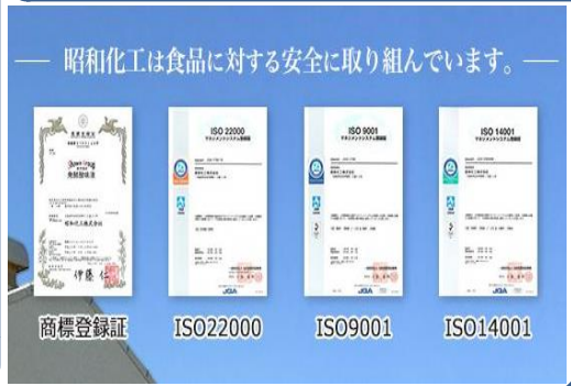
各種ISO取得しています

業種 化学工業 有機酸、無機化合物、機能性材料(医薬中間体、機能性色素、エレクトロニクス材料等)の製造販売。創業102年。原料からお客様を支え、社会に貢献することが私たちの使命です。