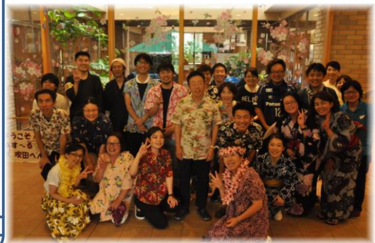
お待ちしております！