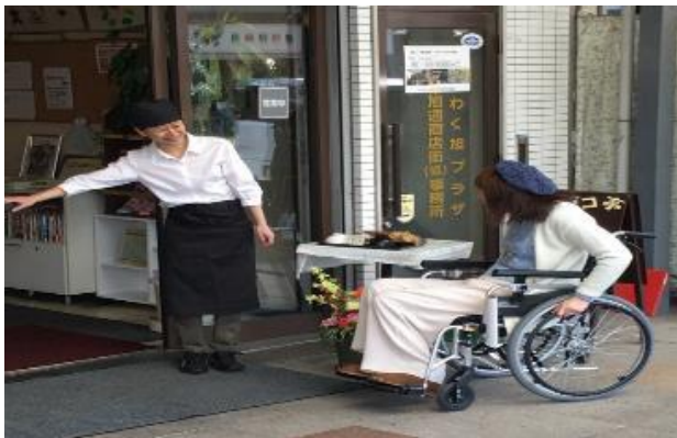
車いすのお客さまにやさしく接するメンバーさん