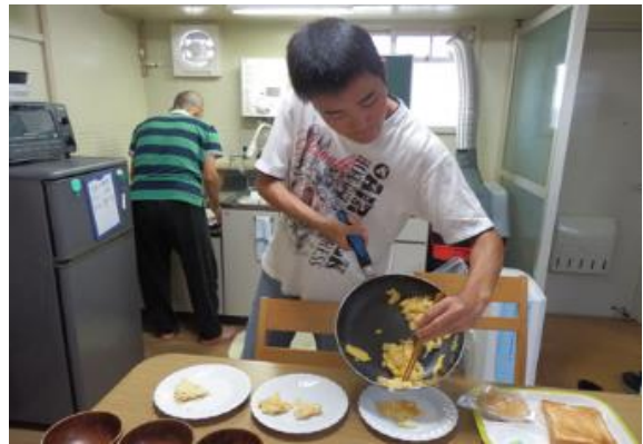
グループホームでの共同生活をしているメンバーさん