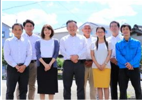
笑顔あふれる我が社の社員の皆さん！