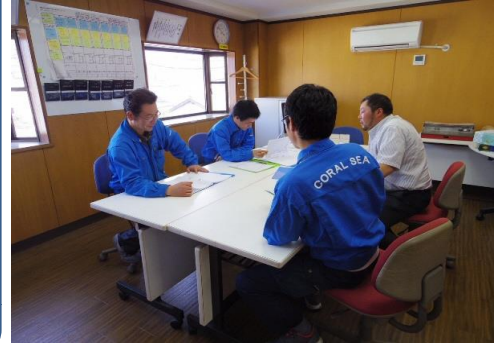
真剣なミーティングでお客様へお役立ちします。