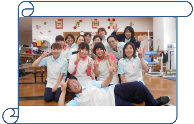
賑やかなスタッフ！一緒に仕事、しませんか？

アピールポイント 新店出店のためのオープニングです。新しい仲間と1から始めてみませんか？ 吹田センターはデイサービスのみでの運営、1日20名定員です。 まずは見学からでもOKです。 日勤のみ、日曜休みで勤務時間帯も応相談 主婦も活躍、働きやすい職場ですよ！ 昼食は社員割引で食べられます。