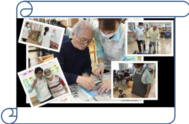
レク、運動等、お客様との絆が深まりますよ！