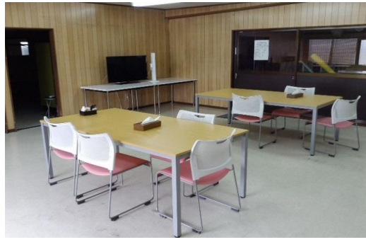
皆でご飯を食べたり…3時のおやつを食べたり…