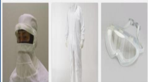
新着商品ラインナップ