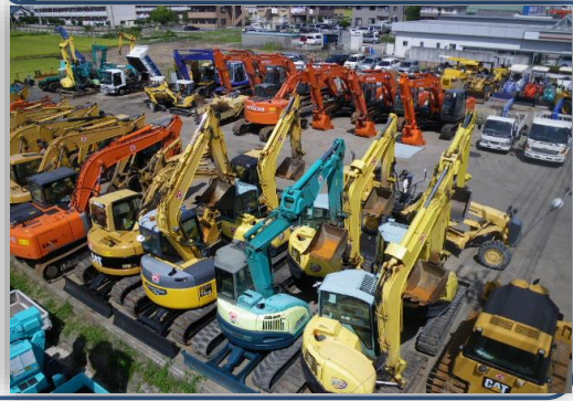
レンタル建設機械