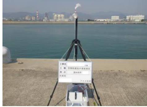
アスベスト気中濃度測定風景