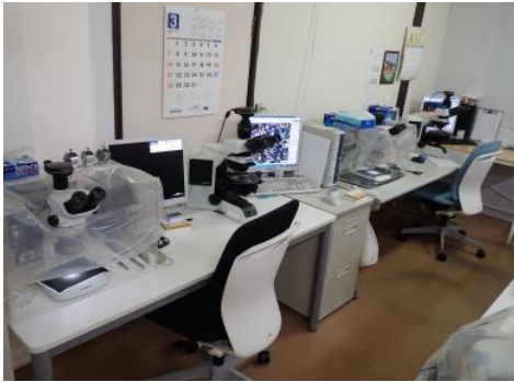
分析機材（偏光顕微鏡・実体顕微鏡）