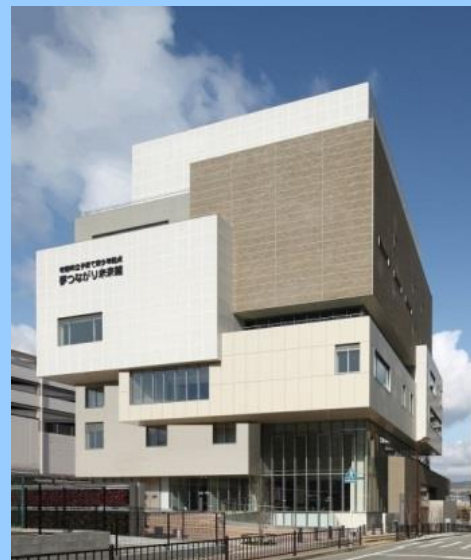
吹田市立子育て青少年拠点 夢つながり未来館