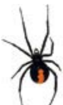
体長はオスが2.5~3mm、メスが10~14mm。体色は暗褐色か黒色。オスは背中赤い斑紋がありません。

市内でセアカゴケグモの生息が確認されています。排水溝などのふたの裏やコンクリートブロックの中、エアコン室外機と壁の間などに潜んでいます。刺激をしなければ人を襲うことはありませんが、誤って触れたときに人をかむことがあります。草刈りなど野外で作業するときは軍手を着用するなど注意しましょう。発見したら家庭用殺虫剤で駆除し、卵が周囲に飛散しないように袋に入れて踏みつぶしてください。かまれたら患部を水洗いし、駆除したクモを持って、医療機関で受診してください。 [環] 環境政策室(6384・1361) 6368・9900。