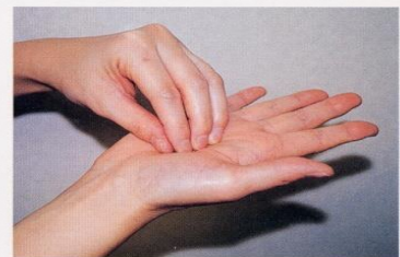
3. 指先、爪の間をよく洗う