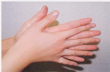
1. 手のひらを合わせ、よく洗う