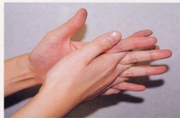
4. 指の間を十分に洗う