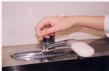
7. 水道の栓を止めるときは、手首か肘で止める。できないときは、ペーパータオルを使用して止める