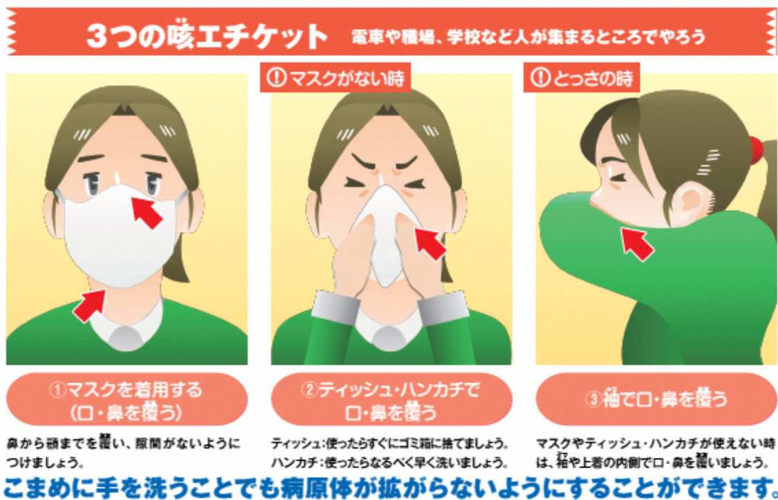
図3 咳エチケットについて