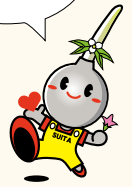
吹田市 イメージキャラクター すいたん

幼児・小学生のイラストや習字を募集。イラストは、はがきサイズの白い紙に描いてください。季節がテーマの作品は2か月前必着。住所、名前(ふりがな)、学校名・学年(幼児は年齢)、電話番号を書いて直接か郵送で広報課(〒564・8550住所不要 ☎6384・1274 ☎6384・7887)へ。作品は返却しません。掲載は1人につき年1回。多数選考。図書カードのプレゼントは終了しました。