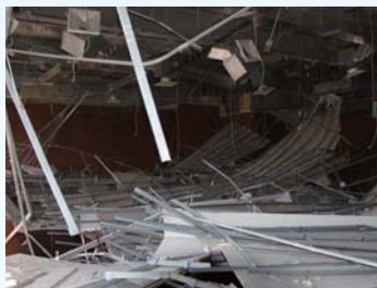
天井が崩落した議場