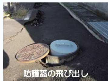
防護蓋の飛び出し