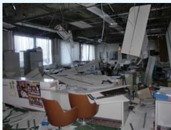
被災直後の町役場の窓口