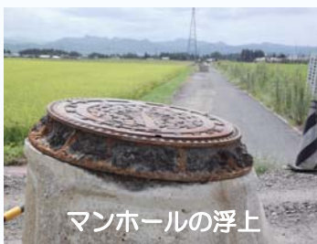
マンホールの浮上