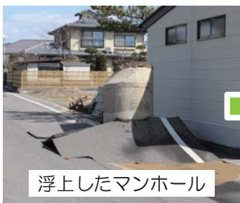
浮上したマンホール