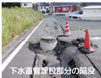
下水道管理設部分の陥没