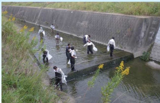
糸田川の清掃作業