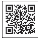
●吹田市邮件发送服务