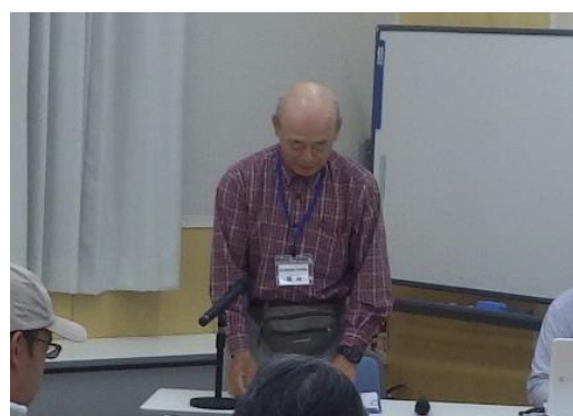
(特活) 野と森の遊び文化協会