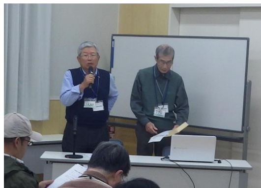
(特活) すいた環境学習協会