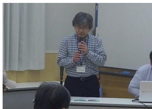
(公社) 千里リサイクルプラザ研究所