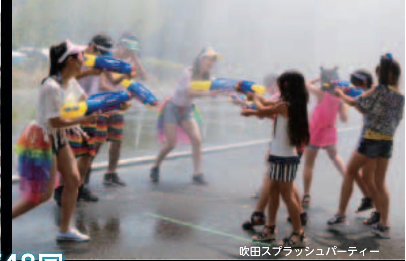
吹田スプラッシュパーティー