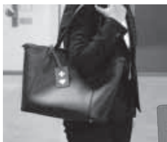
かばんなどに付けることができます

内部障がいや難病、妊娠初期の人などが、周囲に配慮を必要としていることを知らせるヘルプマークを障がい福祉室、総合福祉会館、各地域保健福祉センターで配布します。マークを見かけたら、席を譲る、声をかけるなど思いやりのある行動をお願いします。障がい福祉室(TEL6384・1334 FAX6385・1031)。