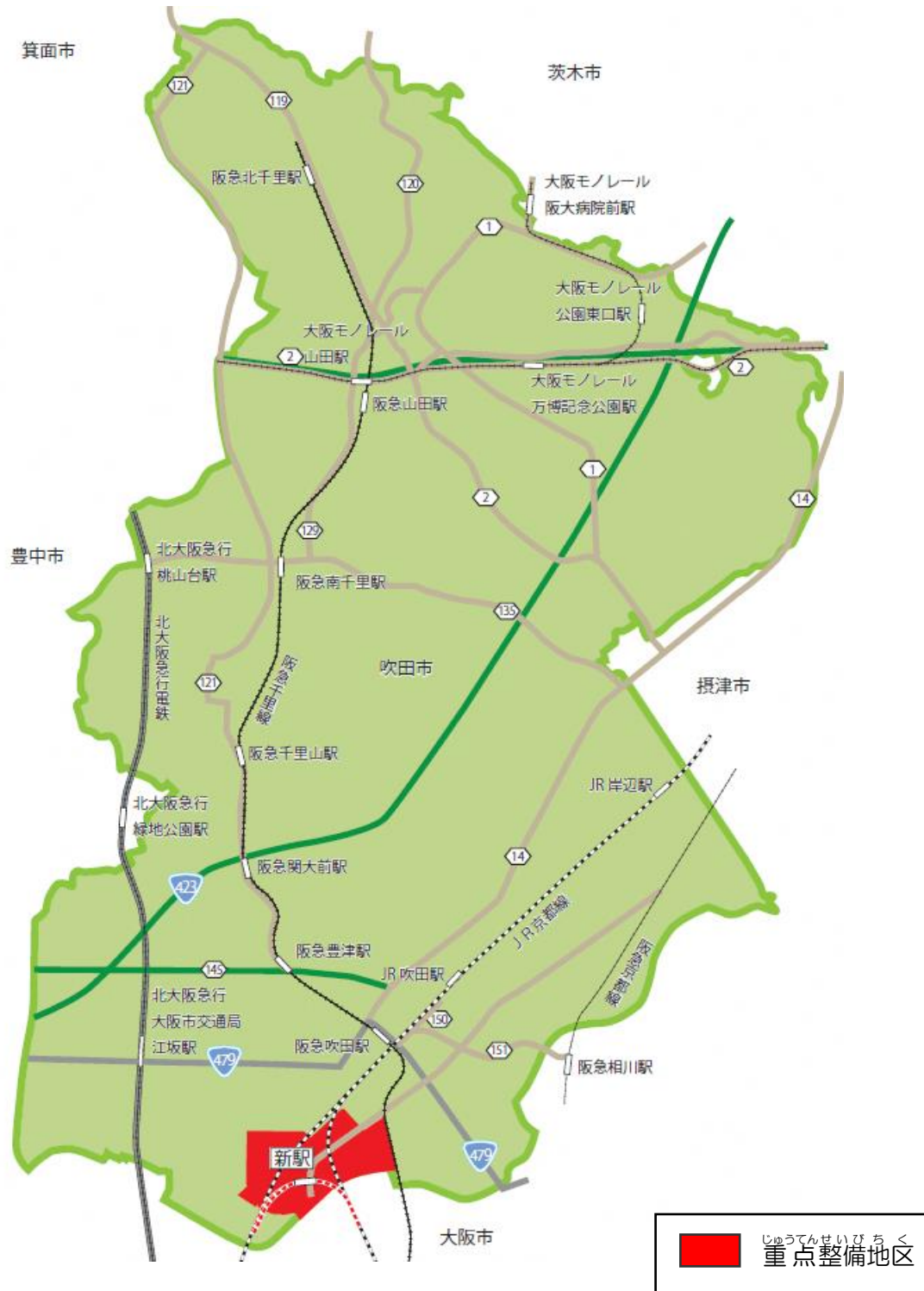
図Ⅱ-1 南吹田地区の重点整備地区位置図