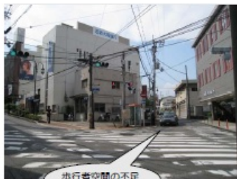
歩行者空間の不足