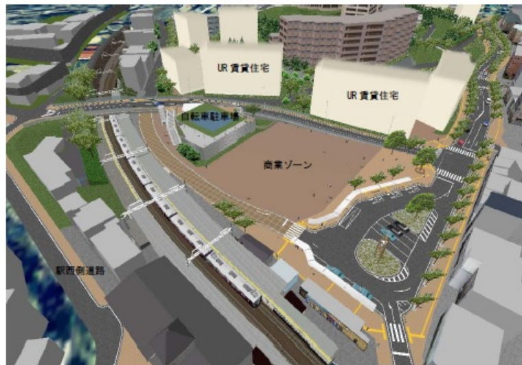
(イメージであり、実際とは異なる場合があります。)