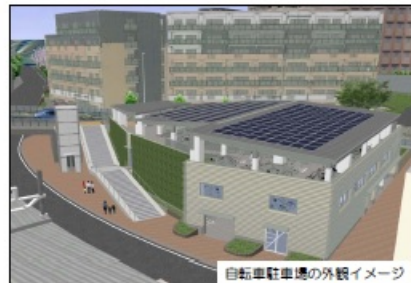
自転車駐車場の外観イメージ