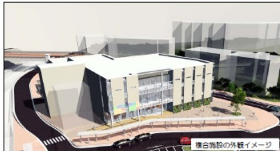
複合施設の外觀イメージ

駅東側商業ゾーンに整備される商業施設(地下1階・地上3階建て)との複合施設の3階部分において、延床面積約1,000㎡のコミュニティ施設を区分所有(床買い)しようとするものです。多目的ホール、会議室、創作室、和室、調理実習室などの貸室と地域の皆様が気軽に立ち寄りいただくことができるコミュニティスペースを配置する予定です。