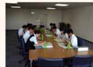
▲検討会議開催風景

各地区で行ったタウンウォッチング(現地点検)では、現況の課題を市民の皆さんで共有しながら、細かくチェックしました。