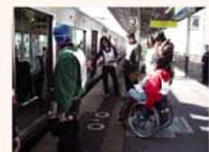
▲タウンウォッチング開催風景

岸部地区、北千里地区ではワークショップを各3回実施し、市民の皆さんからたくさん意見をいただきました。