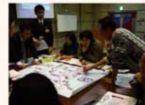
▲ワークショップ開催風景

岸部地区、北千里地区ではワークショップを各3回実施し、市民の皆さんからたくさん意見をいただきました。