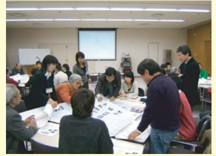
▲ワークショップ開催風景

千里山・関大前地区、南千里地区とも3回実施し、市民の皆さんからたくさんの意見をいただきました。