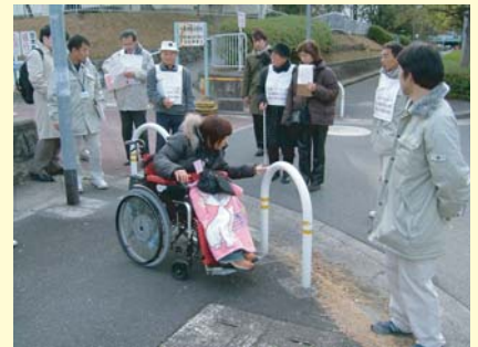
▲タウンウォッチング開催風景

千里山・関大前地区、南千里地区とも3回実施し、市民の皆さんからたくさんの意見をいただきました。