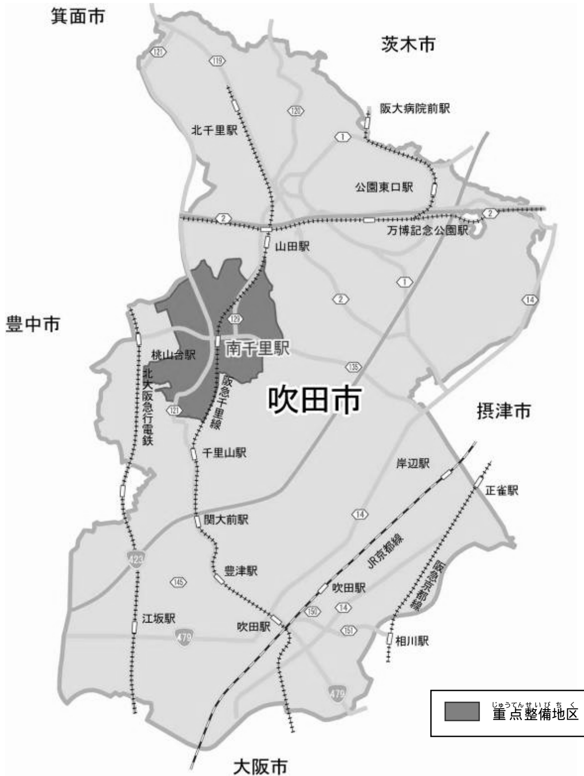
図 -1 位置図