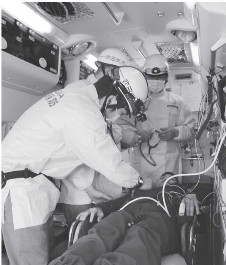
人命を預かる救急隊（救急車内での模擬訓練）

そのほか、消防救急隊の増隊に向け、消防職員の定数を変更する、職員定数条例改正案など、市長から提出された35件の議案はすべて可決しました。