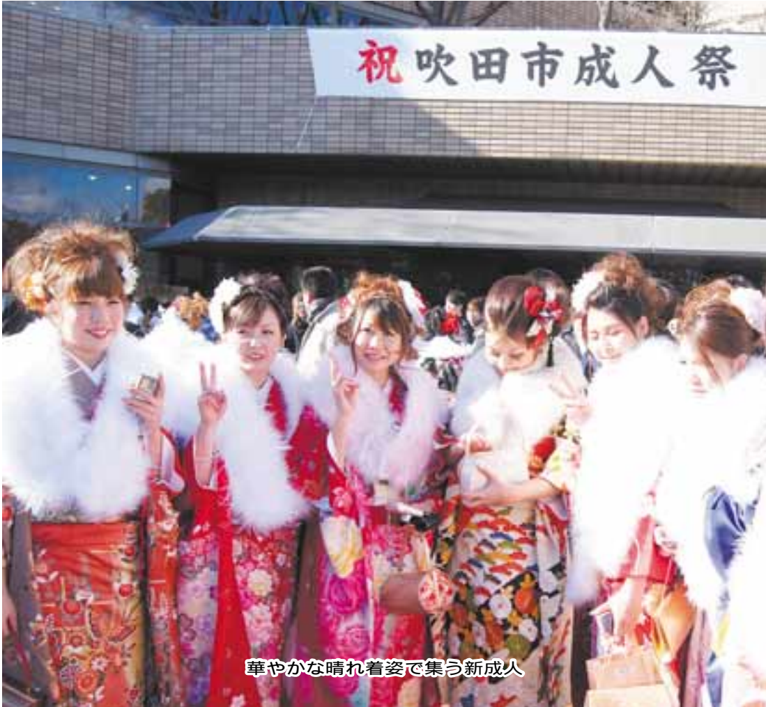
華やかな晴れ着姿で集う新成人

吹田市議会事務局 吹田市泉町1丁目3番40号 直通電話 06-6384-2696 FAX 06-6338-0920