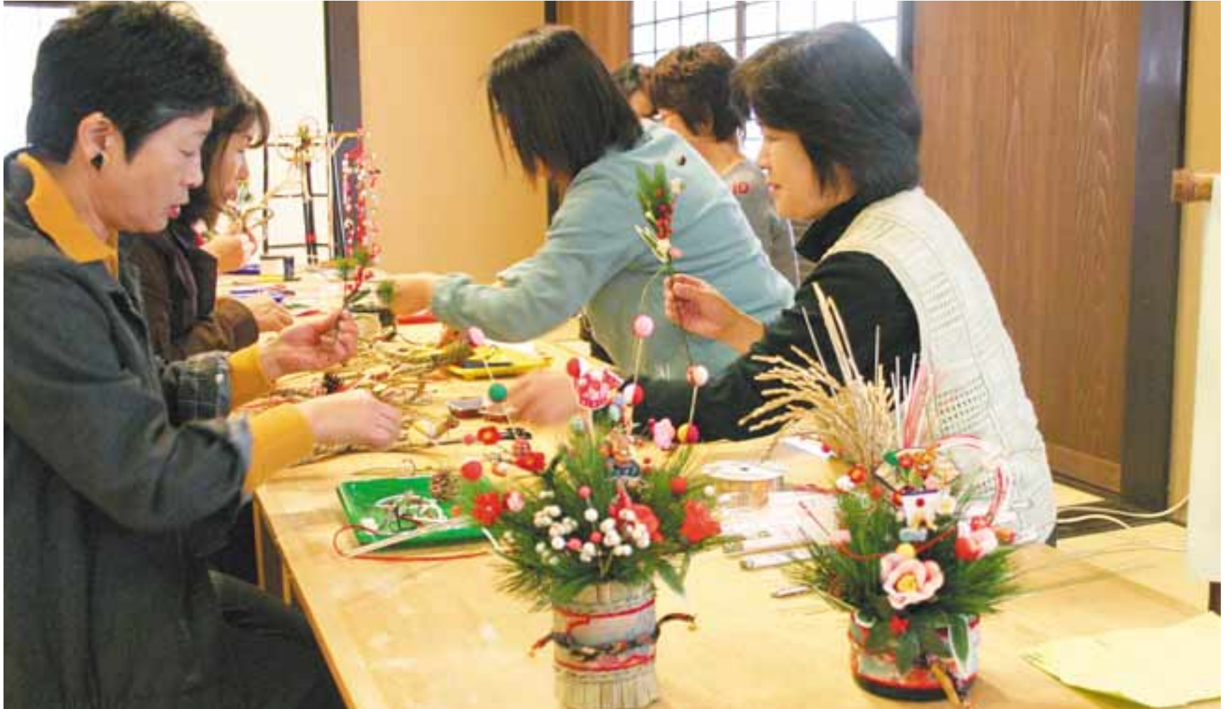
迎春飾り(和のミニリース)づくり教室 (浜屋敷(南高浜町)で昨年11月下旬に開催)

吹田市泉町1丁目3番40号 吹田市議会事務局 代表電話 06(6384)1231 直通電話 06(6384)2696