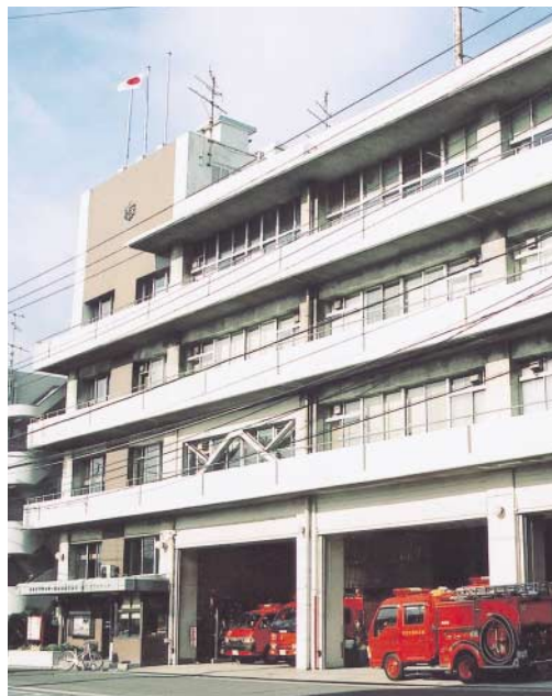
現在、消防本部を有する南消防署

から29・02%としたのと修正の申出とともに、今後、一層経費の削減を行い、効率的な維持管理に努め、未整備地域の水洗化並びに浸水対策、合流式下水道の改善等の課題についても解消