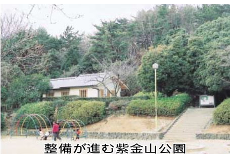
整備が進む紫金山公園

ミニ市場公募債についても、市民が納得できるものとなるよう、民主的な判断を求めその上で事業の決定、推進を図らなければならぬ。当初予算があるにもかかわらず、いきなりこのような方策で財源を確保しようとしているが、今後は当初予算できっちり方向を示し、議会の審議を経てから充当対象事業を選考するよう強く要望する。