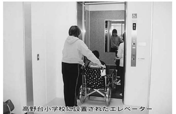
高野台小学校に設置されたエレベーター

答 同校には養護学級が4学級あり、3人の肢体不自由児を含む13人の障害のある児童が在籍している。また、来年度も重度重複障害児童の入学が予定されていることや、同校区内には、肢体不自由児通園施設わかたけ園や市民病院があることなどから、同校のエレベーター設置の必要度は高いと考えている。教育委員会としては、障害のある児童や同校を取り巻く