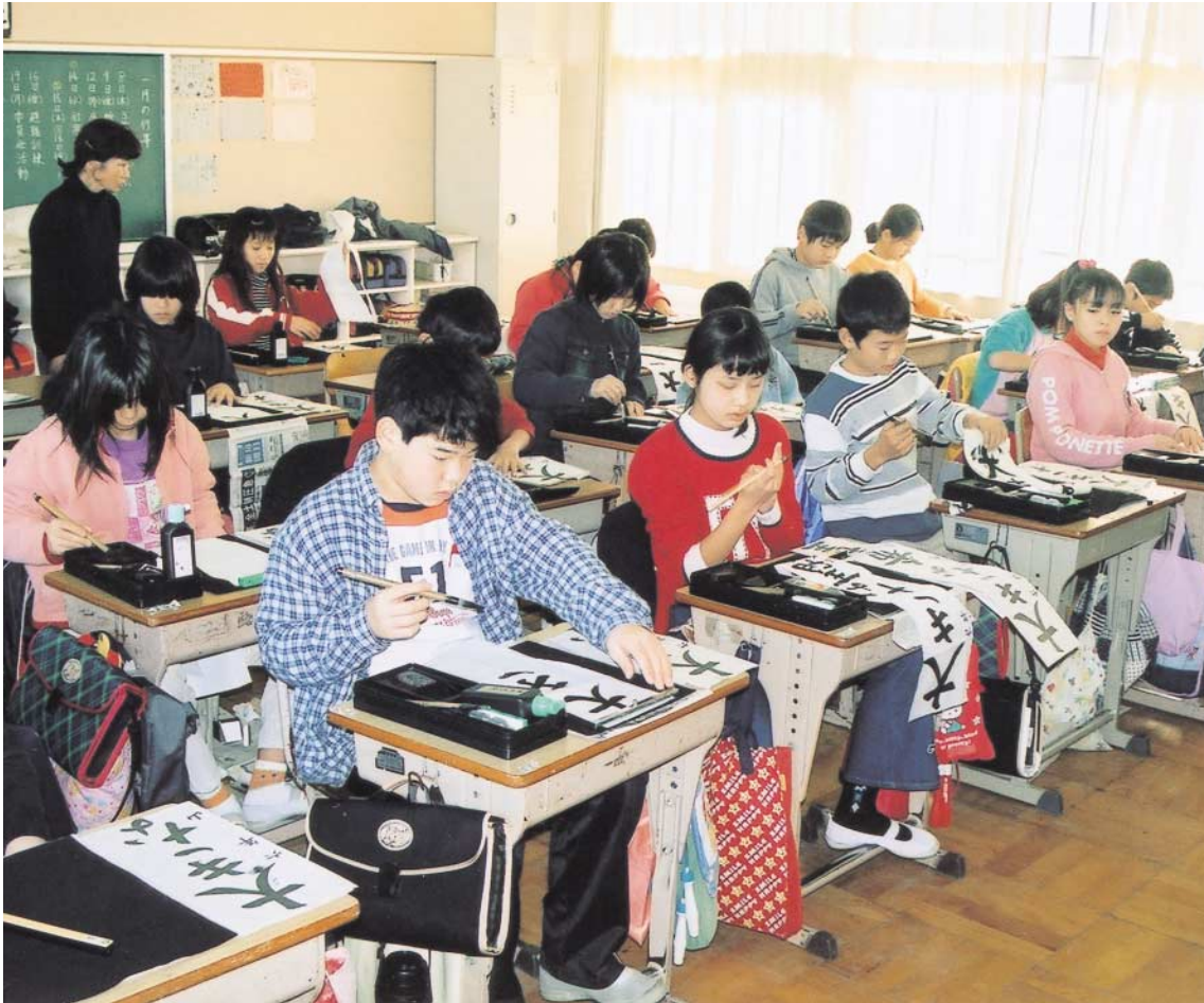
新年を迎え、書き初めを行う児童たち(豊津第一小学校6年生)

編集者 和田 学 奥谷 正実・六島 久子 竹村 博之・山根 孝 発行所 吹田市泉町1丁目3番40号 吹田市議会事務局 電話 06(6384)1231