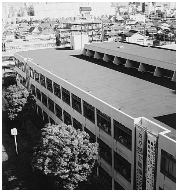
屋上緑化工事が中断している市庁舎低層棟

答 本市では平成9年(1997年)度に行財政改革実施方針、同改善計画を策定し、行財政改革の取組みを進めてきた。中でも、健全な財政基盤の確立を目指し、平成12年(2000年)度には財政健全化計画(案)