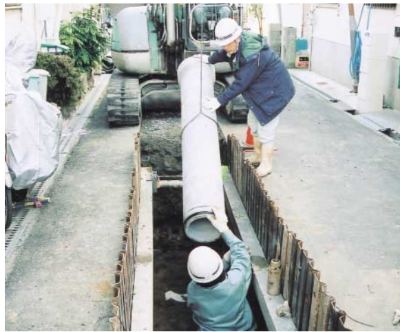
市内で行われている下水道工事

から29・02%としたのと修正の申出とともに、今後、一層経費の削減を行い、効率的な維持管理に努め、未整備地域の水洗化並びに浸水対策、合流式下水道の改善等の課題についても解消