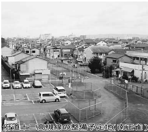
府道十三高槻線の整備予定地(南正雀)

問 画道路十三高槻線の本市吹東町の六田川から摂津市の正雀一津屋線までの正雀工区は、地元自治会が大府への用地売却に最大限の協力をしてきたが、府が大府学院大学や同高等学校のグランド用地の買収に着手し、整備が進んでいないため 答 同工区は、事業区間が1.3kmと長く、正雀川や阪急京都線の地下に道路を通すアンダーパス工事が必要であり、多大な事業費を要することから、現在、府では、正雀一津屋線から豊中岸部線までの区間を重点的に整備する方針で用地取得を進めている。 本市としては、地域の活性化や都市機能の向上を図るためにも、同路線全体が早期に完成するよう府に強く要望するとともに、同路線から豊中岸部線への接続についても、あわせて要望していきたいと考えている。今後とも地元の要望を聞きながら円滑に事業が進捗するよう、より一層努力していきたい。