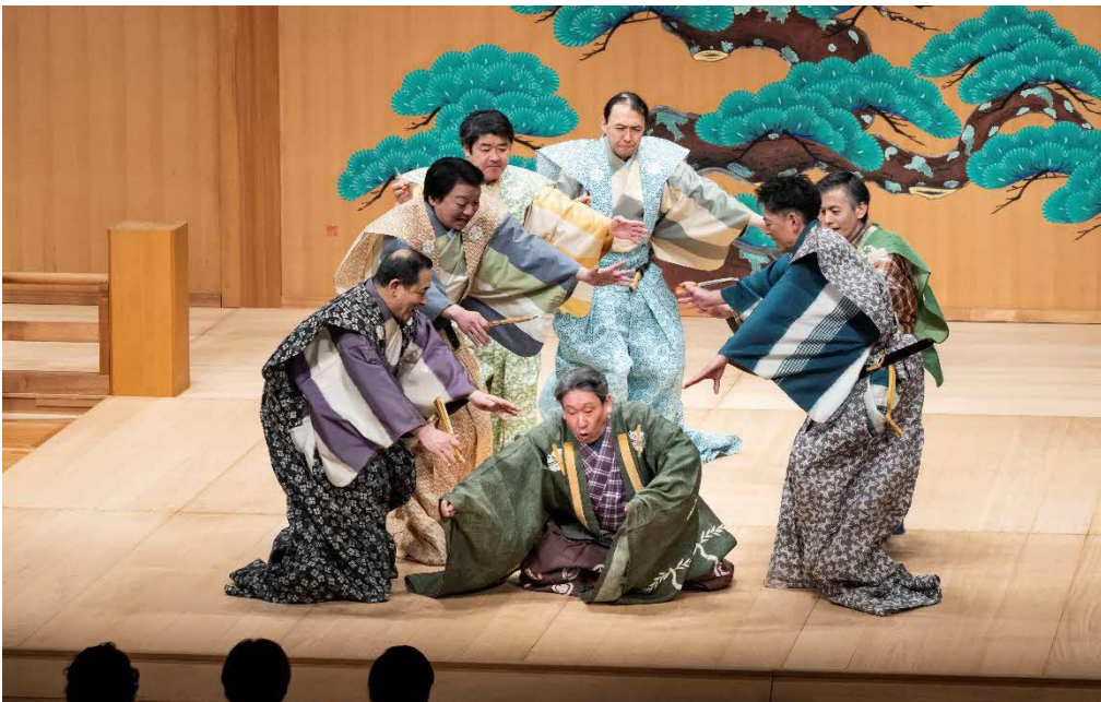
2/8 メシアター狂言会