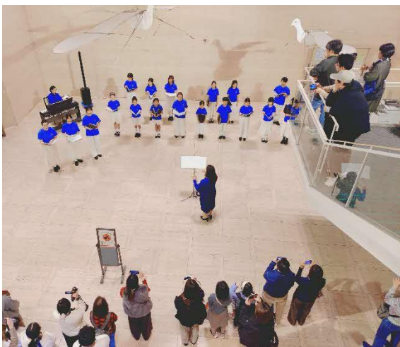
11/3 メイシアター少年少女合唱団ロビーコンサート