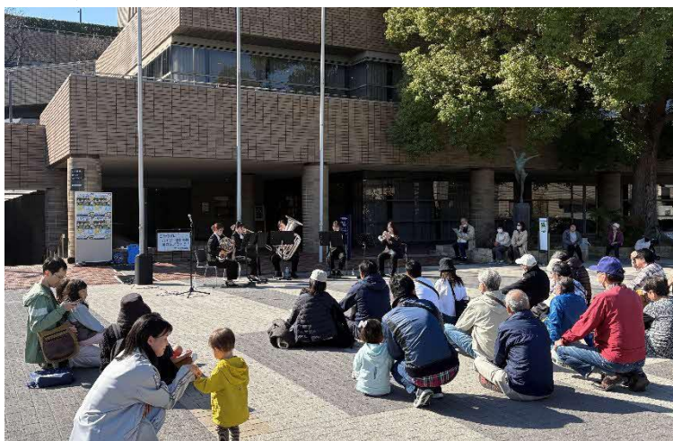
11/8 公園ライブ金管五重奏