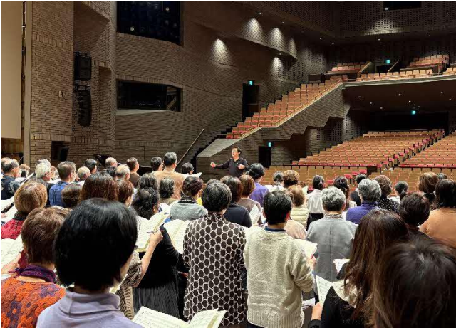
12/21 吹田市民の第九 練習