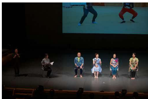
障がいの有無や特性を問わず参加者を公募し、5歳から70歳までの32名が12日間の稽古を経て上演しました。アフタートークでは創作プロセスを紹介しました。