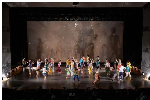
吹田市民劇場 ダーバシティダンス公演 セレノグラフィカとあなたがおどる ～このカラダ、満開に～ 10月12日(日) 中ホール 演出振付/セレノグラフィカ