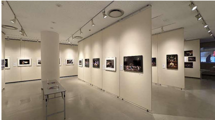
11/25 日本舞台写真家協会展