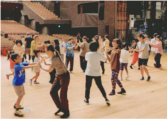
10/12 ダンス公演 このカラダ、満開に 練習