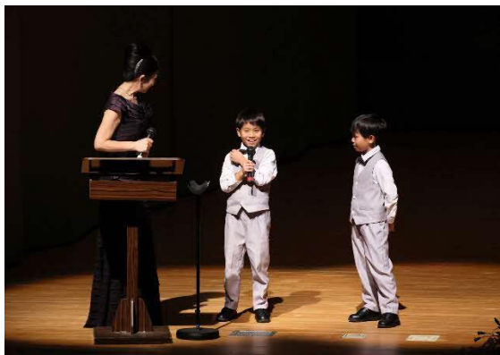
12/14 すいたティーンズクラシックフェスティバル