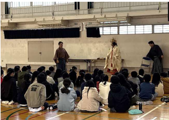
1/16 能楽ワークショップ