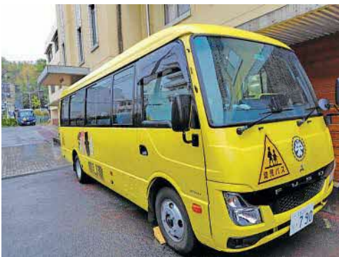
杉の子学園の通園バス

○児童発達支援事業 19万円 杉の子学園およびわかたけ園の通園バスにおける位置情報配信システムの導入に係る経費