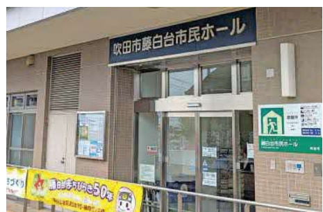
藤白台市民ホール