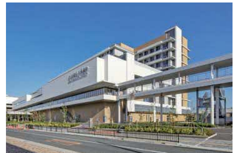
地方独立行政法人市立吹田市民病院