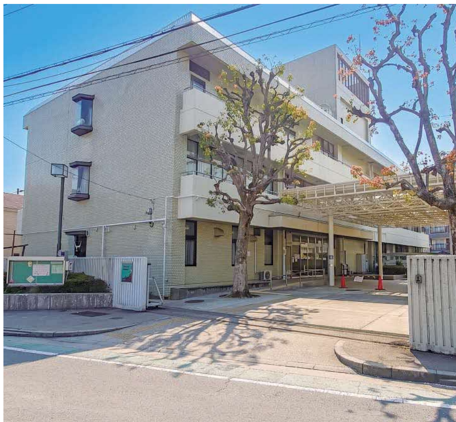
移転・集約建て替えを予定している 青少年クリエイティブセンター(岸部中1丁目)

には、青少年クリエイティブセンターの移転・集約建て替えに係る基本構想の策定経費や、JR吹田駅南立体駐車場の跡地を活用した特定教育・保育施設等整備支援事業、北千里駅前地区市街地再開発事業に係る経費などが計上さ