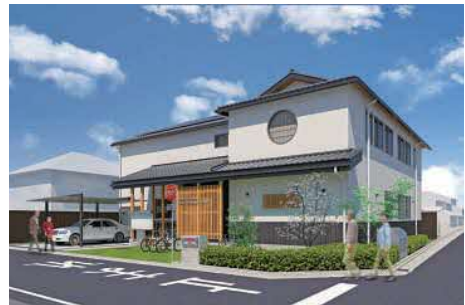
移転後の吹一地区公民館 完成イメージ