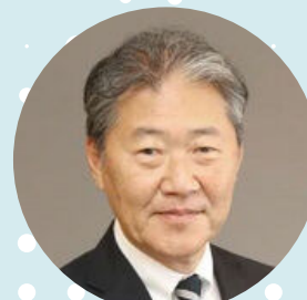
吹田市長 後藤 圭二