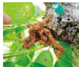
うどん状に固まったフラス 見つけたら同室へ連絡を

サクラなどの幹を食い荒らすため、樹木が枯死したり、枝が落ちたりして、倒木につながり非常に危険です。全国的に被害が広がっており、市内でも発見されています。繁殖力が強く、放置しておくくと大量に増殖します。うどん状のフラス(幼虫のふんと木くずが混じったもの)のある樹木を見つけたら、環境政策室(☎6384・1361 FAX6368・9900)へ連絡してください。また、被害拡大防止のため、成虫をその場で踏みつぶすなど、駆除に協力をお願いします。