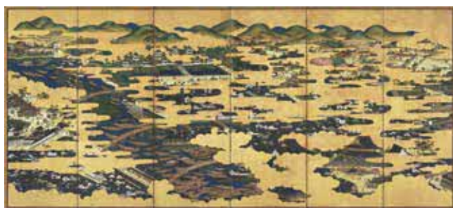
浪花名所図屏風(左隻)