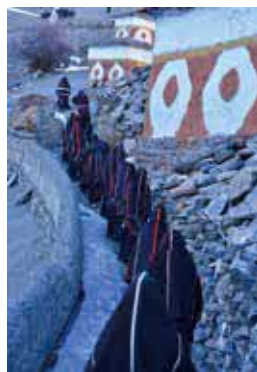
寺を巡る(2019年 サルダ ン村)

時。入館は午後4時30分まで。¥780円。大学生340円。高校生以下無料。所同館(TEL)6876・2151(FAX)6875・0401)。