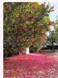
ピンクのじゅうたん

公園を散歩していると、ふと目に入ったのが、さざんかの花びらが一面に広がるピンクのじゅうたん。周りは冷たい空気に包まれているのに、その部分だけが春のようにきらめき、心が温くなるようでした。