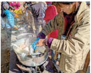
非常食を作る様子

〒520-1641 滋賀県高島市今津町南生見 TEL 0740-240131 FAX 0740-240431