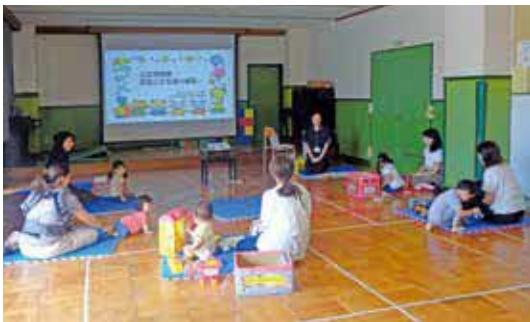
末就園の親子向けのお話会の様子

1月23日(金)に五月が丘児童センターで「園長先生のお話」を、1月31日(出)に朝日が丘児童センターで「けん玉教室」を開催します。 問五月が丘児童センター(TEL/FAX 6337・0266)、朝日が丘児童センター(TEL/FAX 6330・0133)