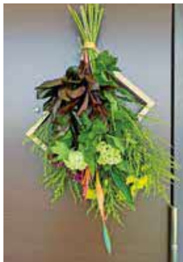
生花のスワッグ作り

公民館やPTA、自治会などの要望に応じて、花の寄せ植えなどの講習会を行います。詳しくは同センターホームページへ。所市内