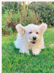
しっかりお片付け!だけども Pちゃん

大事なおもちゃやおやつは庭に穴 を掘って隠しているよ。でもいつも どこに隠したかわからなくなるんだ。