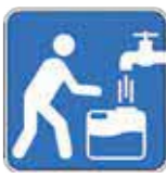
給水拠点の看板デザイン