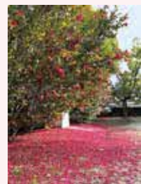
ピンクのじゅうたん ことろう

公園を散歩していると、ふと目 に入ったのが、さざんかの花びらが一 面に広がるピンクのじゅうたん。周 りは冷たい空気に包まれているのに、 その部分だけが春のようにきらめき、 心が温くなるようでした。