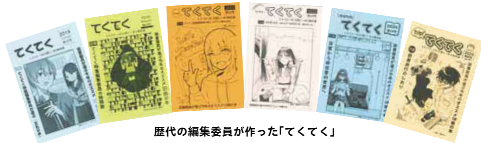
歴代の編集委員が作った「てくてく」