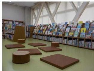
中央図書館絵本コーナー