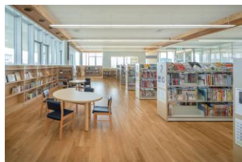
健都ライブラリー児童室