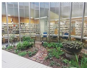
山田駅前図書館光庭

北千里図書館は月の最終火曜日、北千里図書館以外は月の最終木曜日。いずれも祝日と重なるときはその翌日