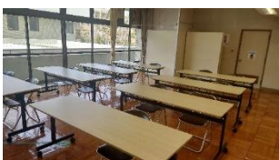
自習室(高校生以上が利用できます)