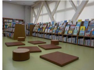
中央図書館絵本コーナー