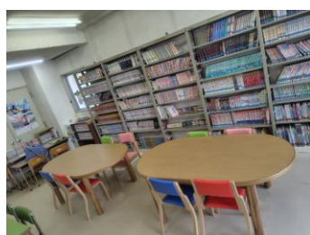
読書もできます。 人気の漫画も置いています。(各館で広さや環境は異なります。)