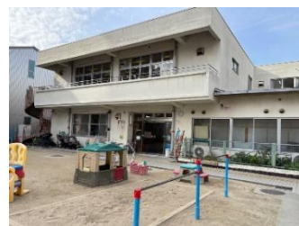
外で遊ぶこともできます。