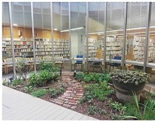
山田駅前図書館光庭

北千里図書館は月の最終火曜日、北千里図書館以外は月の最終木曜日。いずれも祝日と重なるときはその翌日