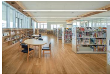
健都ライブラリー児童室