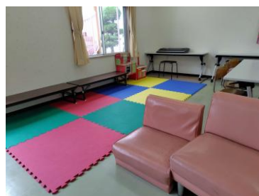
くつろげる場所があります。