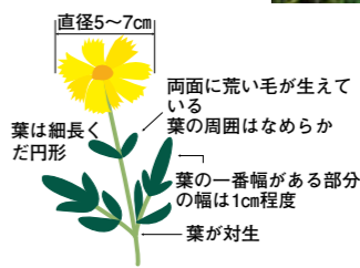
直径5〜7cm 両面に荒い毛が生えている葉の周囲はなめらか 葉の一番幅がある部分の幅は1cm程度 葉が対生 葉は細長くだ円形