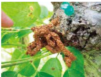
うどん状に固まったフラス 見つけたら同室へ連絡を

クビアカツヤカミキリの幼虫は、サクラなどの幹を食い荒らすため、樹木が枯死したり、枝が落ちたりして、倒木につながり非常に危険です。全国的に被害が広がっており、市内でも昨年6月に初めて発見されました。繁殖力が高く、放置しておくと大量に増殖します。うどん状のフラス(幼虫の糞)と木くずが混じったもののある樹木を見つけたら、環境政策室(☎63384・1361 FAX6368・9900)へ連絡してください。また、被害拡大防止のため、成虫をその場で踏みつぶすなど、駆除に協力をお願いします。