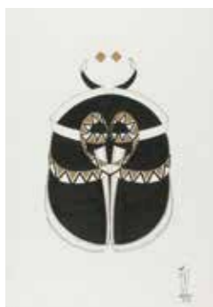
イザベラ・ウフマン作「メタモルフォシス」(2021年)

日常を彩る製品をデザインする「技術」であったアラビア書道が、「芸術」として再定義された軌跡をたどります。関6月17日(火)まで。午前10時～午後5時。入館は午後4時30分まで。関580円。大学生250円。高校生以下無料。関関国立民族学博物館(関6876・2151 関6875・0401)。