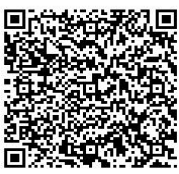
自治会長届 (電子申込システム)