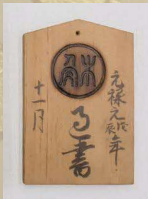
過書舟鑑札(当館蔵)