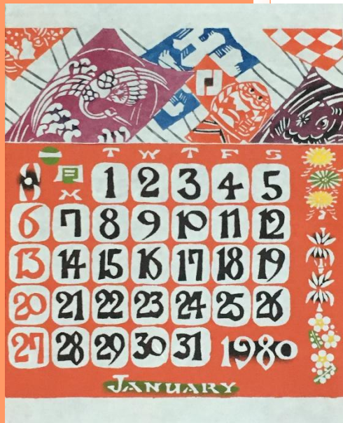
芹沢銑介カレンダー