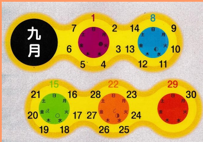
モリサワカレンダー

カレンダー・デザインは素っ気ないものから奇抜なものまで多種多様です。江戸時代には大小暦 だいしょうれき といって、大の月(30 日)と小の月(29 日)の配列 ひきふだれき 順を絵に隠したものが流行しました。明治中期からは引札暦 ひきふだれき と称する、広告宣伝を兼ねた暦 ふうび が一世を風靡しました。戦後は文字どおり百花繚乱、なかでも全国カレンダー展で表彰されたユニークな作品を紹介いたします。