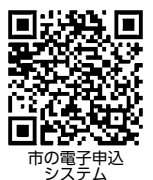
市の電子申込 システム

市報すいたの配布については(株)リビングプロシード(☎4309・6280 ㊟4309・6427)へ、泉町3丁目、金田町、川園町、五月が丘西、五月が丘東、出口町、西の庄町、穂波町、南金田1丁目の配布は(一社)吹田市障がい者の働く場事業団(☎6170・8141 ㊟6317・1231)へ問い合わせてください。