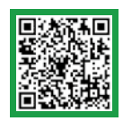
友だち登録はこちら

ライン LINEで友だち登録を すると、「健都ヘルスサポ ーター」イベント参加ポ イントがもらえます。