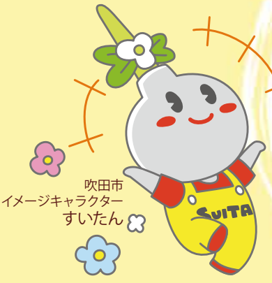
吹田市 イメージキャラクター すいたん