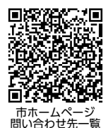
市ホームページ 問い合わせ先一覧

市の人口 38万3669人(前月比+422人) 男18万2673人 女20万996人 世帯数 18万6401世帯 (9月30日現在)