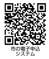
市ホームページ 問い合わせ先一覧