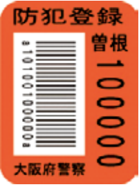
防犯登録済みのシール

令和5年中の府内での自転車盗難の被害件数は2万5195件。そのうち約半数は鍵をかけていない状態で被害に遭っています。駐輪する際は、たとえ短時間であっても必ず鍵をかけましょう。また、自転車防犯登録は自転車盗難の予防と被害の早期回復に役立ちます。登録は法律上の義務です。必ず行いましょう。 関 危機管理室 (TEL)6384・1753 FAX6369・6080。