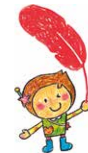
吹田市社協イメージ キャラクター「きらら」