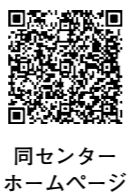
同センターホームページ