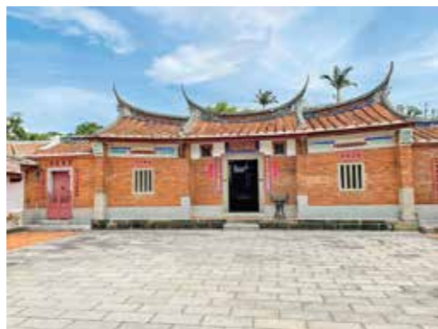
台湾の客家居住区にある三合院形式の建物

陸・台湾の関係史を紹介します。 時12月3日(火)まで。午前10時～午 後5時。入館は午後4時30分ま で。¥500円。大学生250円。高校生 以下無料。所岡国立民族学博物館 (TEL)6876・2151 FAX)687 5・0401)。