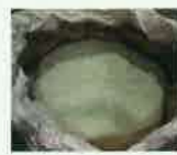
破碎・選別したガラス