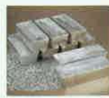
有用金属(銀)のイメージ