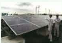
太陽発電設備の検査の様子

使用済みとなった太陽光 パネルには、再販売可能な ものもあり、既に多くのリ ユース事例が報告されて います。