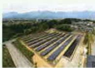
リユース品を使用した発電所