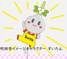
吹田市イメージキャラクター すいたん

藤原社会保険労務士事務所 特定社会保険労務士 大阪府社会保険労務士会理事、大阪南支部顧問 公益財団法人介護労働安定センター 雇用管理コンサルタント